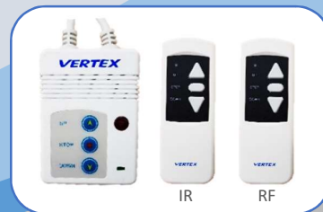
Wireless/Infrared Remote Control*