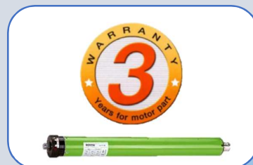
Standard tubular motors